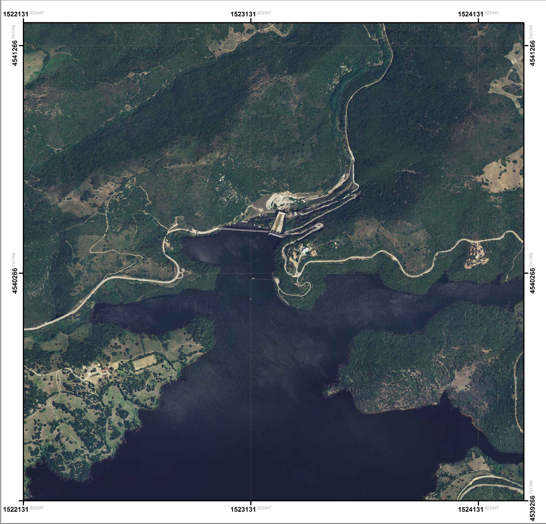
Stralcio Ortofotografico - IGM Tavoletta 427 Sezione II 1:10 000