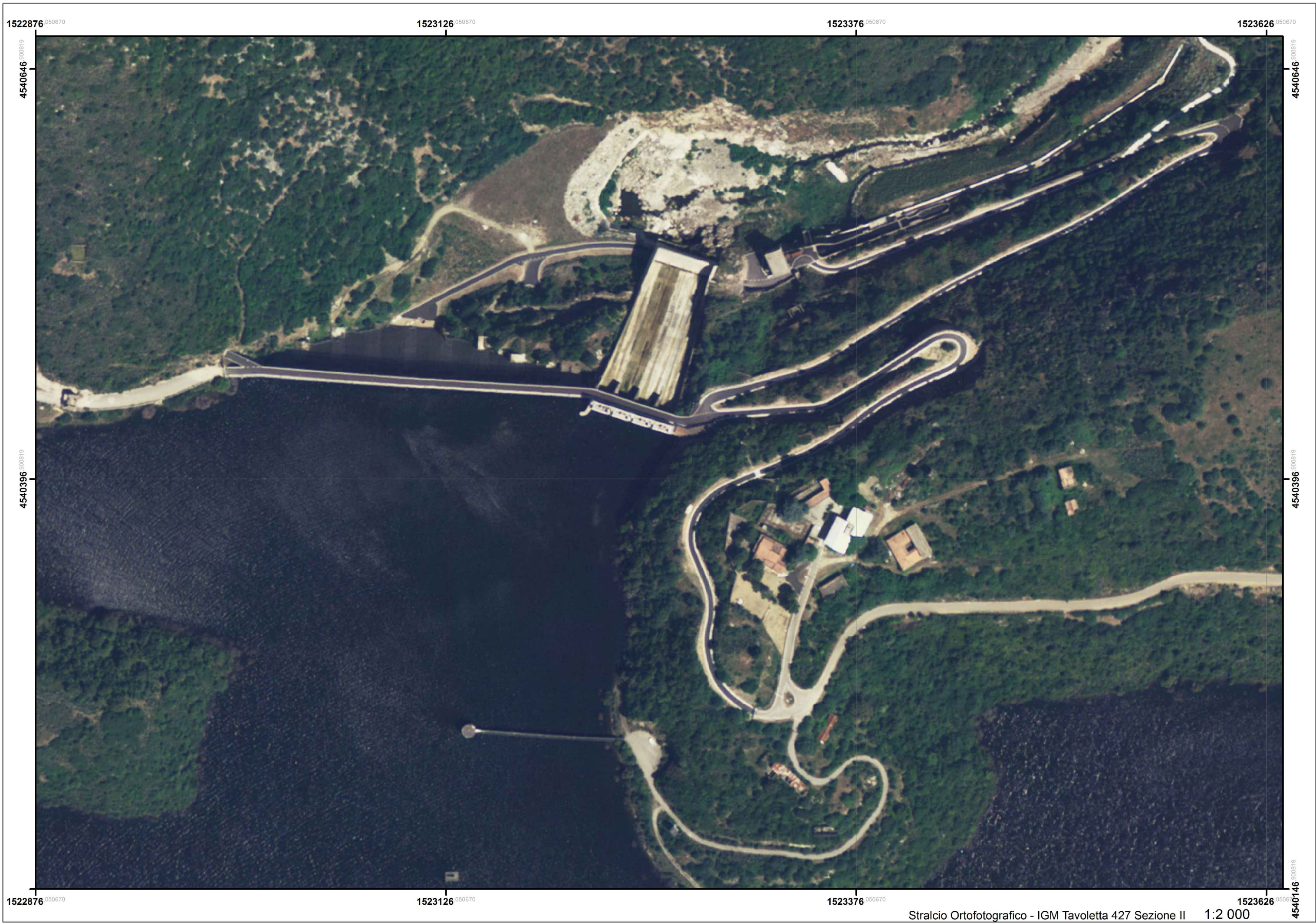
Stralcio Ortofotografico - IGM Tavoletta 427 Sezione II 1:2 000